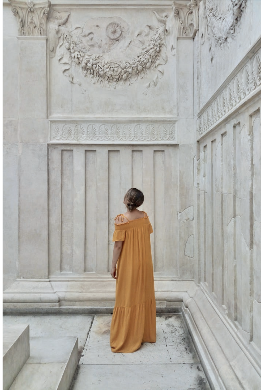
Ara Pacis [ 2 ]