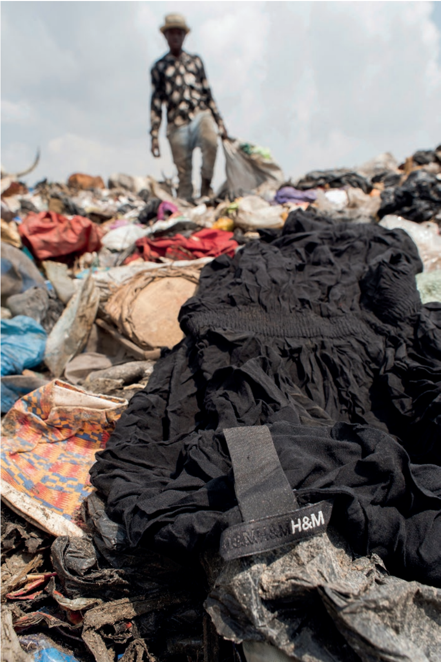
Usar y tirar, perversa moda rápida. (Marcas que contaminan) [ 2 ]