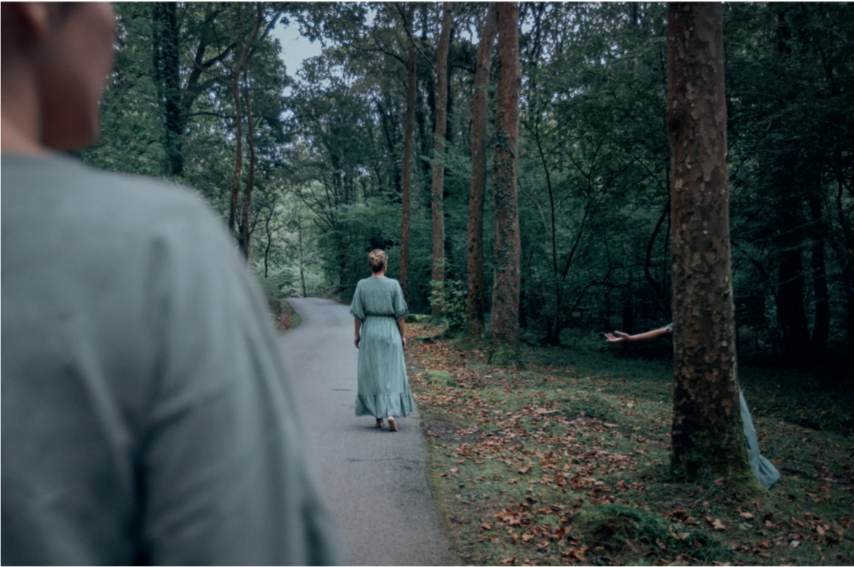
21 gramos [ cristales ]

Universidad a Distancia de Madrid UDIMA | ESPAÑA |