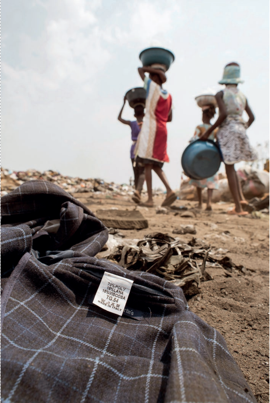
Usar y tirar, perversa moda rápida. (Marcas que contaminan) [ 4 ]