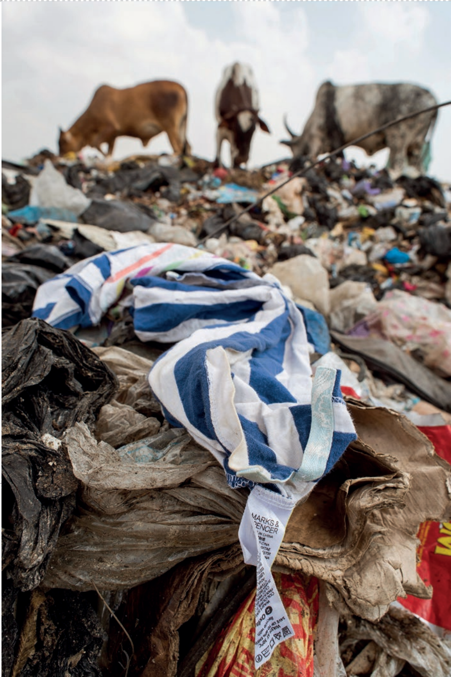
Usar y tirar, perversa moda rápida. (Marcas que contaminan) [ 1 ]