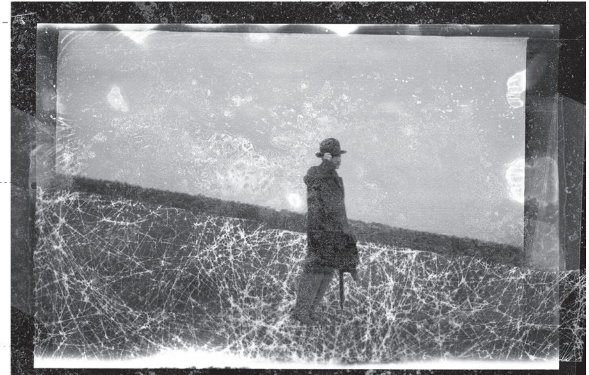
Mascarade [ 1 ]

Universidad nacional de educación a distancia UNED | ESPAÑA |