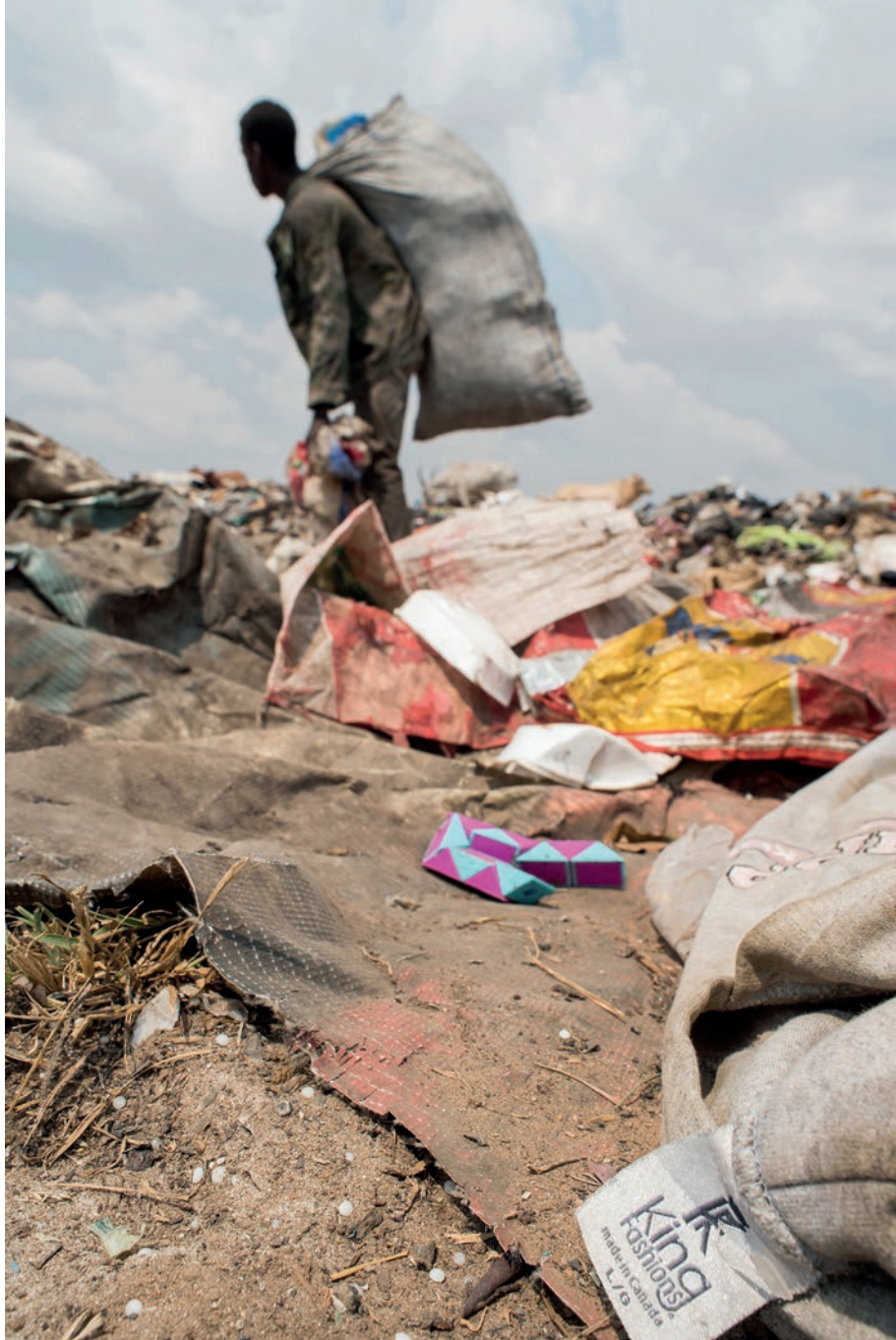
Usar y tirar, perversa moda rápida. (Marcas que contaminan) [ 3 ]