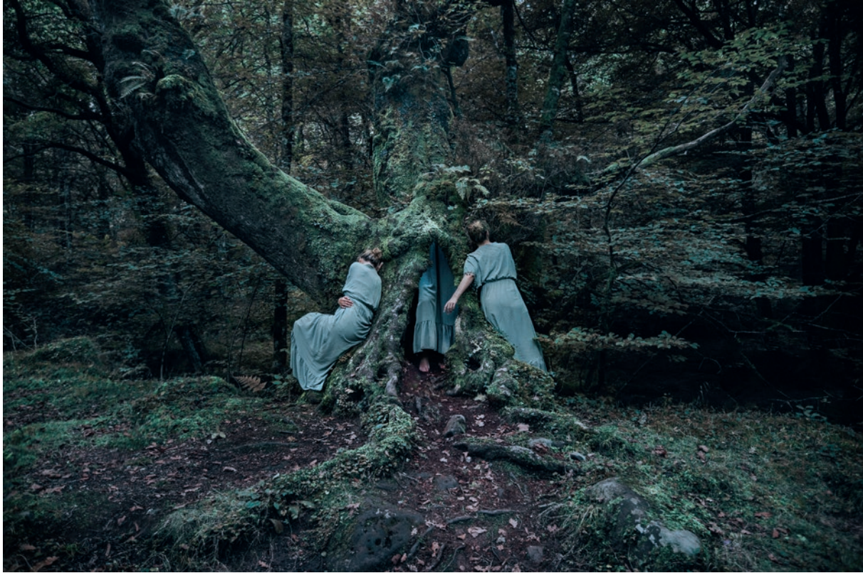
21 gramos [ solo ahí ]