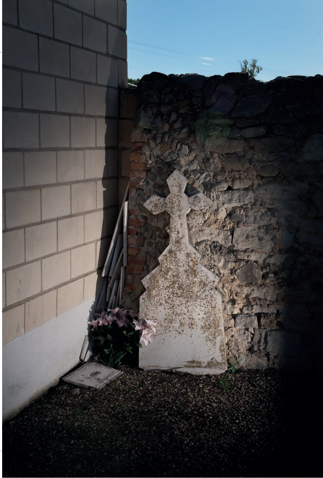
Un puñado de tierra [ el cementerio ]