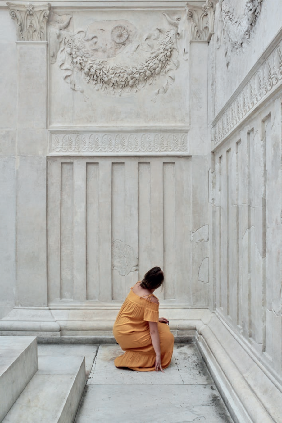
Ara Pacis [ 1 ]

Ángel García Roldán Universidad de Granada | ESPAÑA |