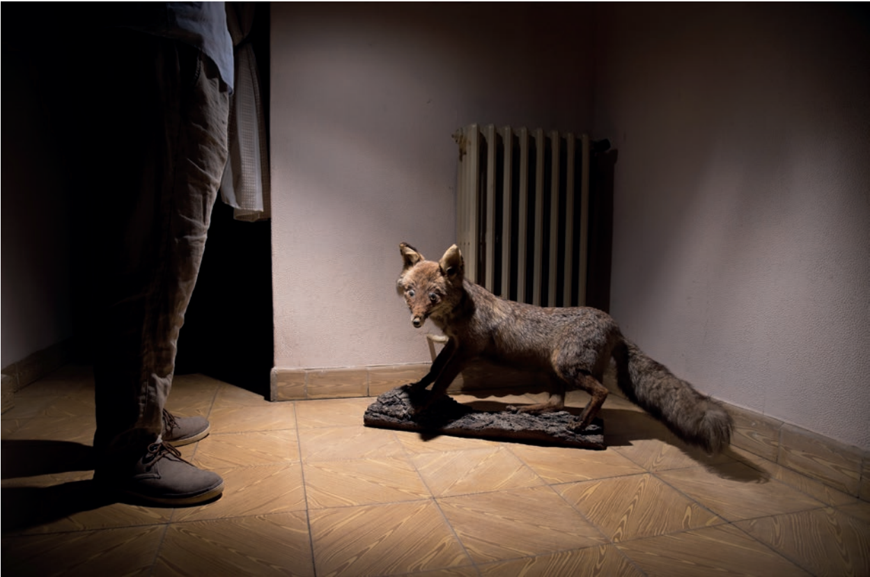
Un puñado de tierra [ el raposo ]