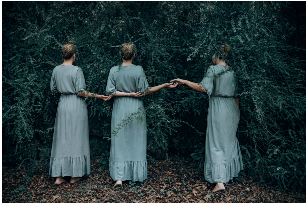
21 gramos [ siempre será de noche ]