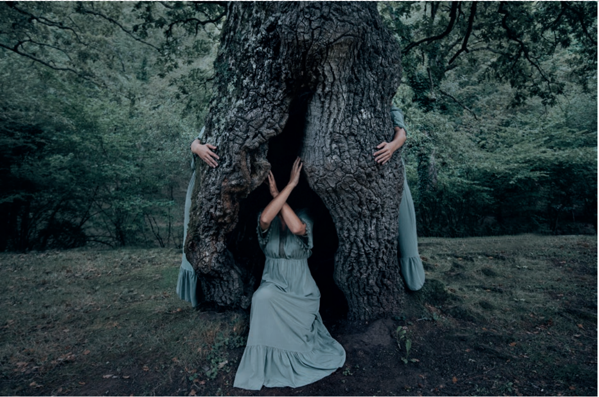
21 gramos [ ignífuga ]