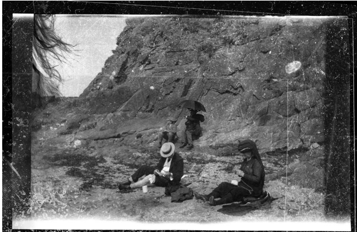
Mascarade [ 2 ]