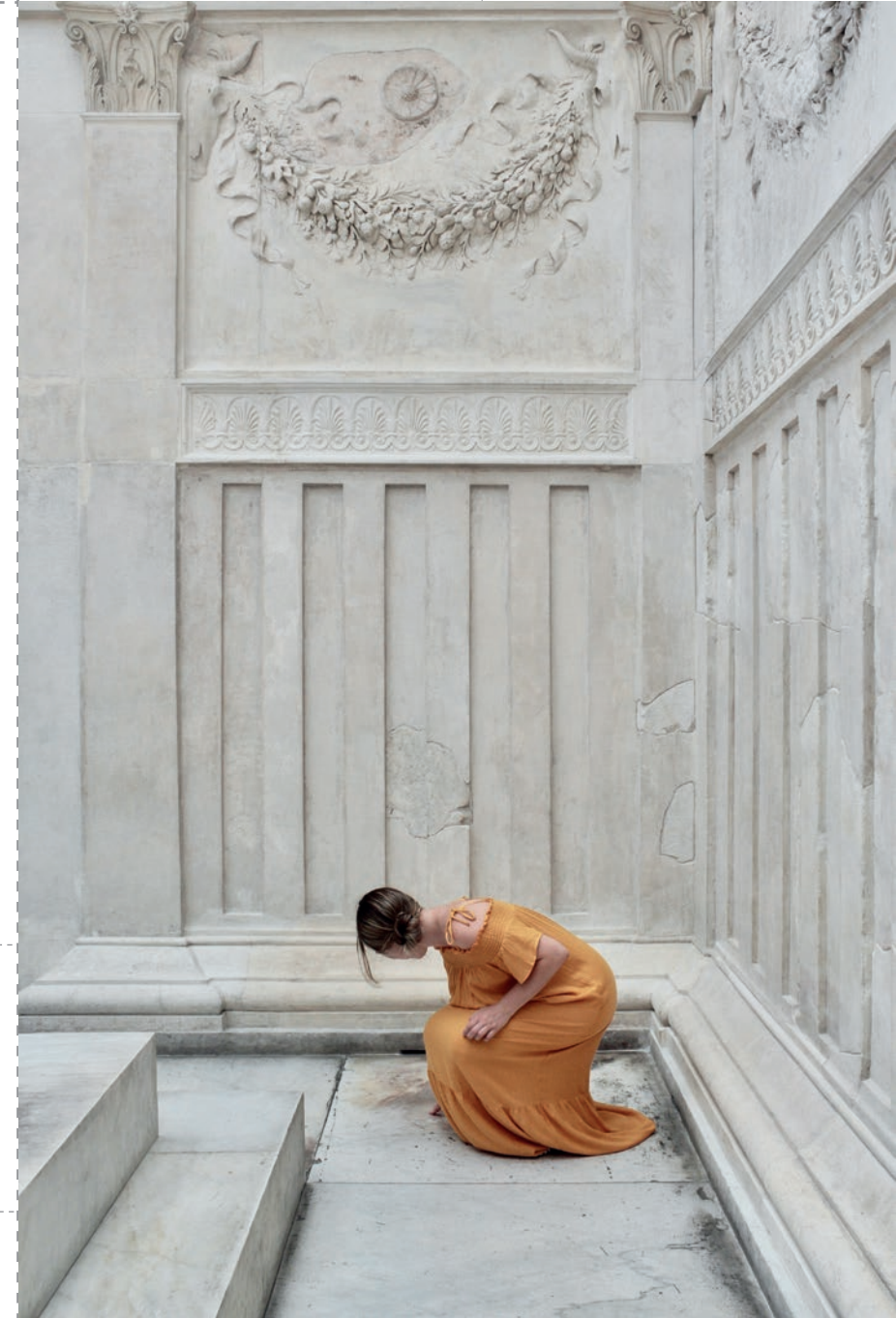
Ara Pacis [ 3 ]