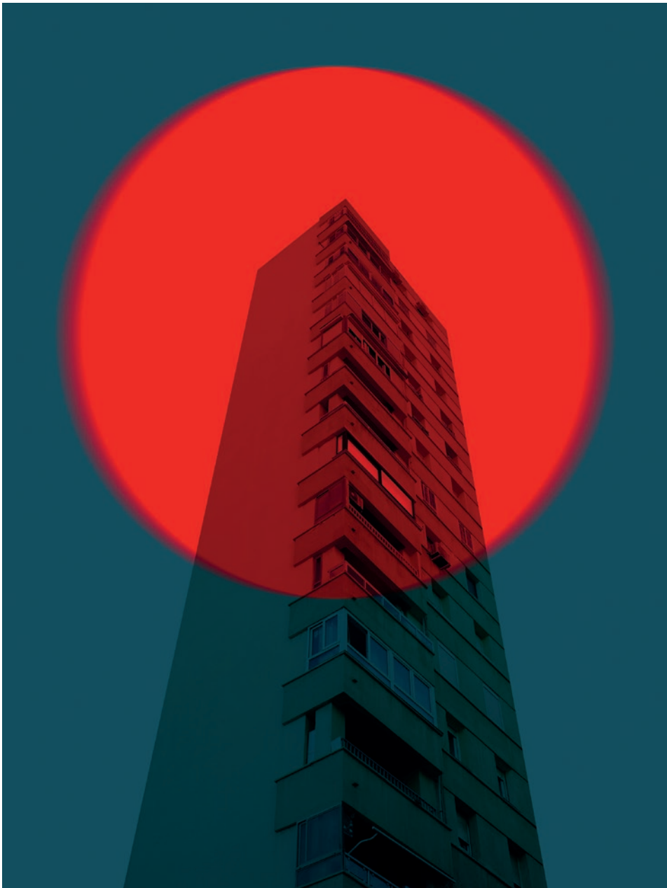
Vértigo Urbano [ 1 ]