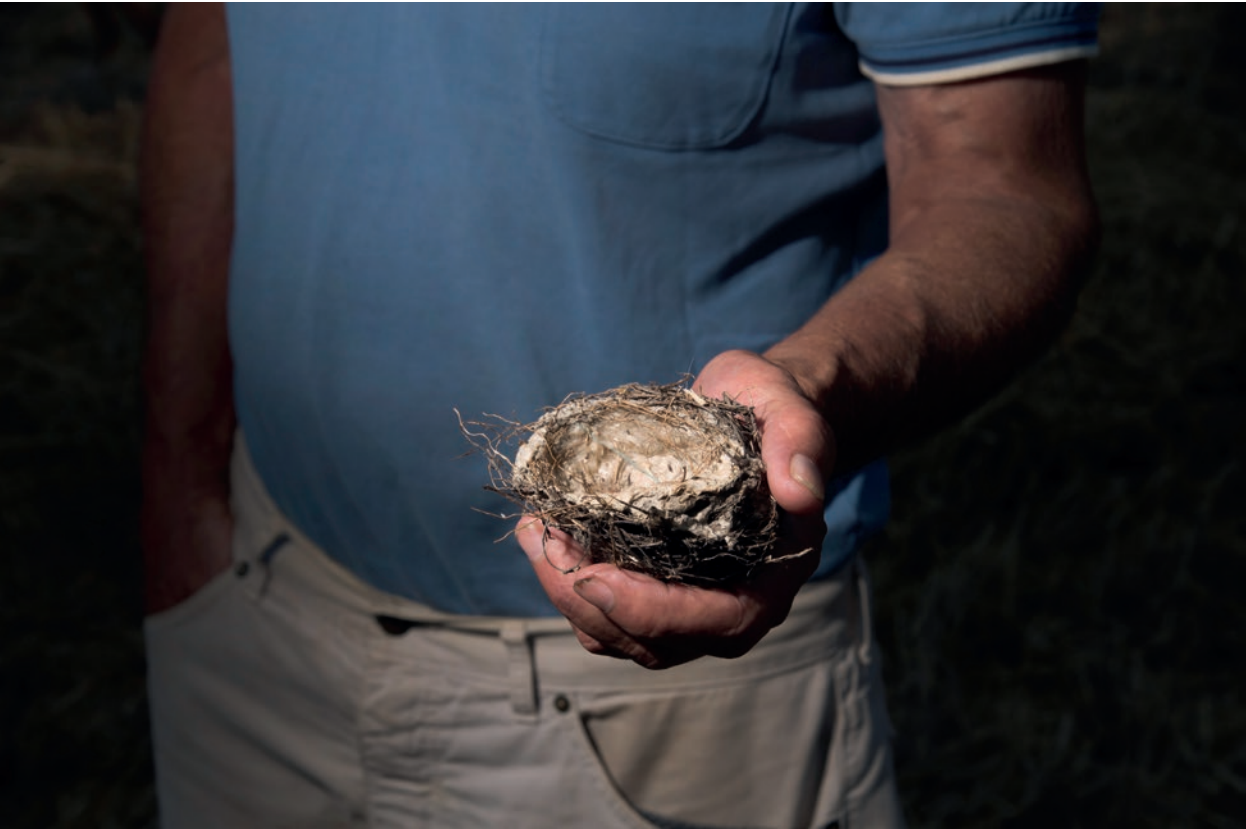
Un puñado de tierra [ el nido vacío ]