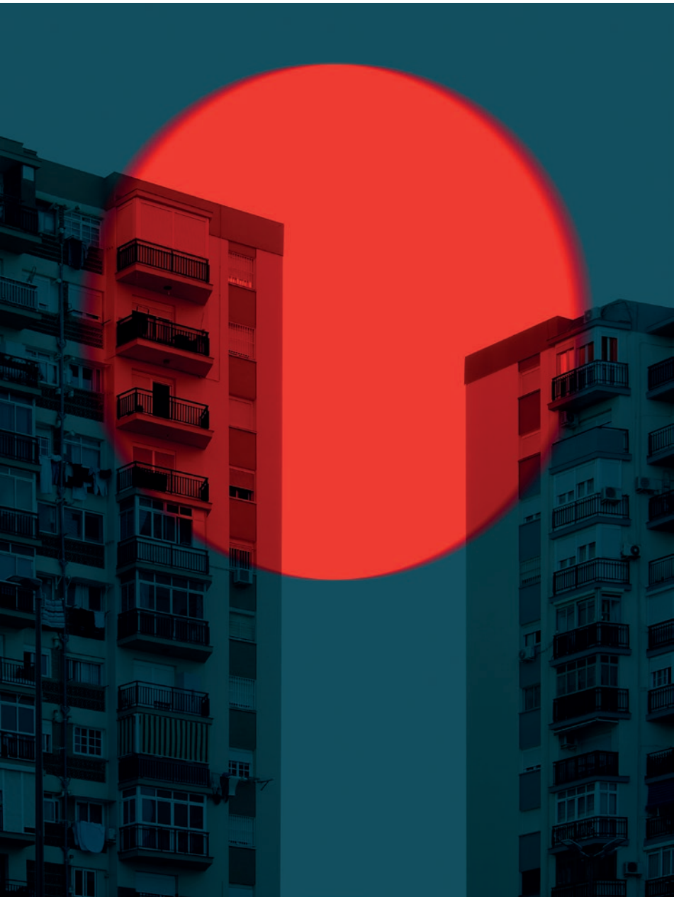
Vértigo Urbano [ 2 ]