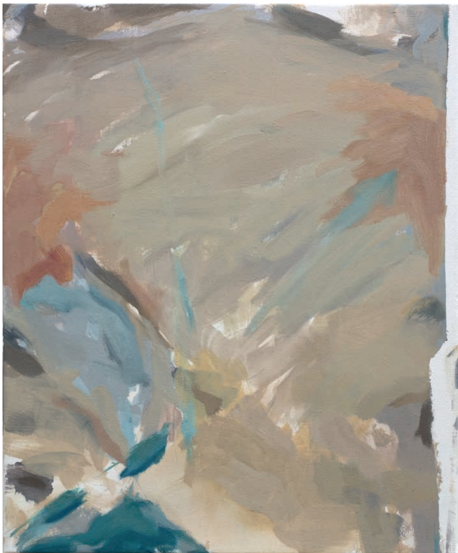
Elección 1 | Técnica mixta sobre lienzo | 46 x 38 cm