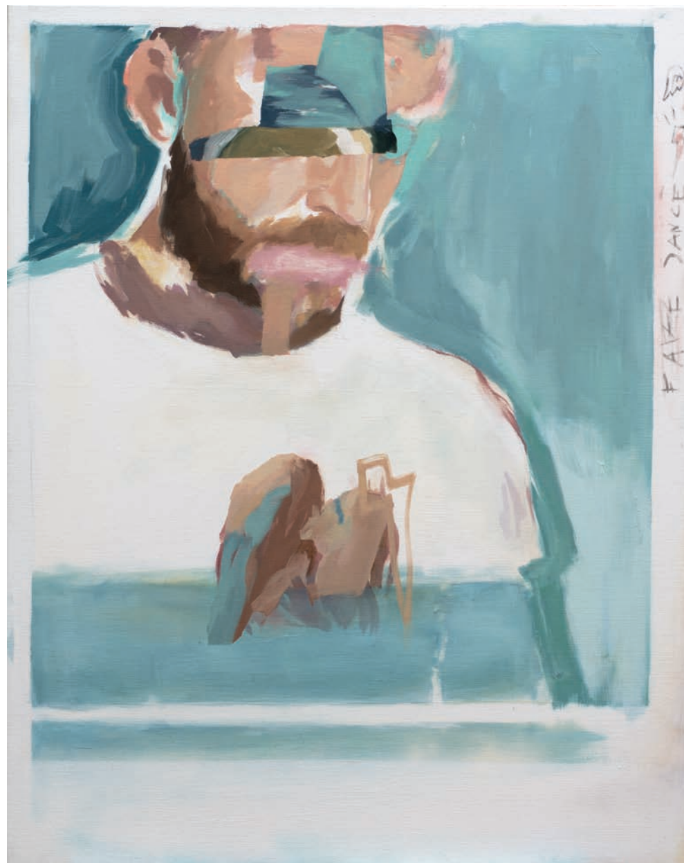
En el sentido común | Técnica mixta sobre lienzo | 92 x 73 cm