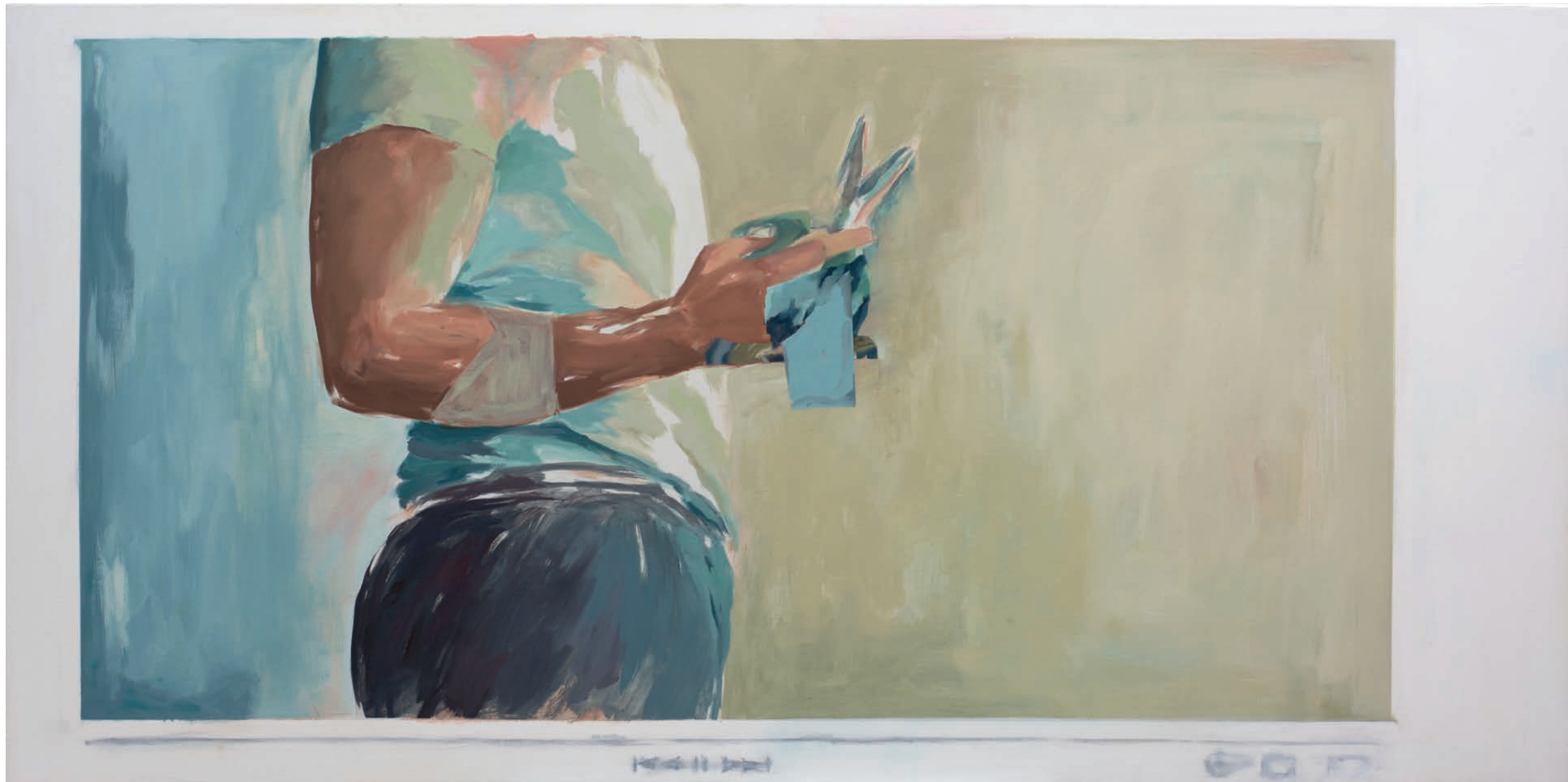
La interpretación | Técnica mixta sobre lienzo | 80 x 160 cm