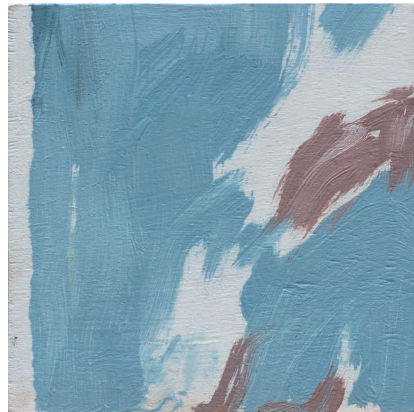
Encaje | Óleo sobre tabla | 10 x 10 cm