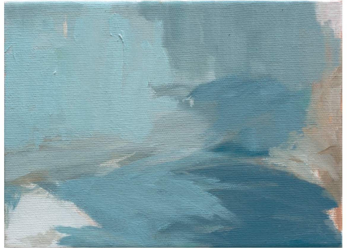
De la esencia 2 | Técnica mixta sobre lienzo | 22 x 16 cm