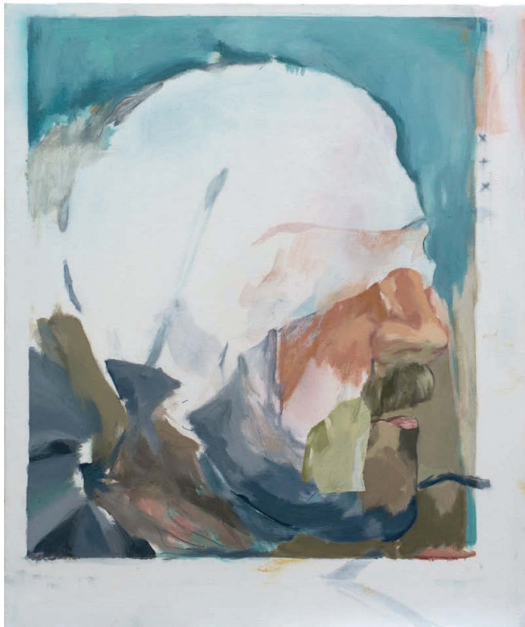
Tiempo y distancia | Técnica mixta sobre lienzo | 55 x 46 cm