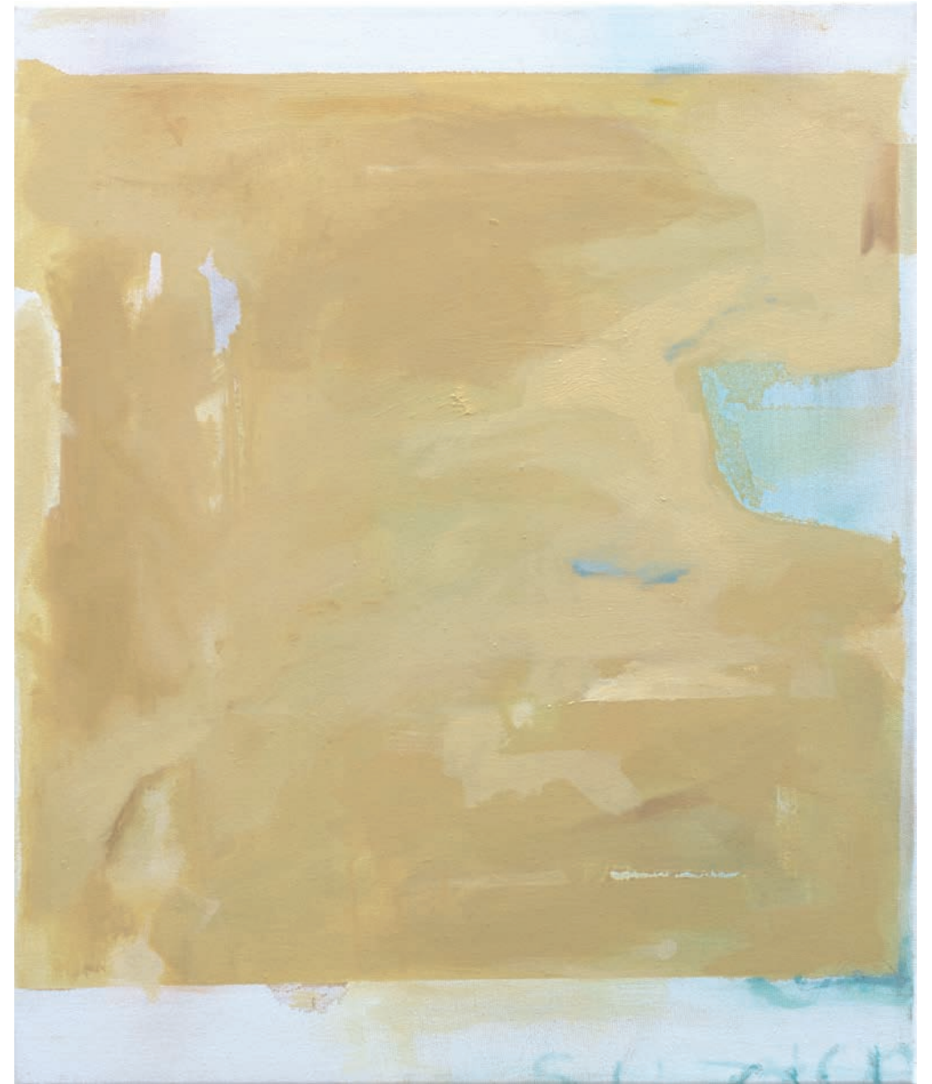
Lo esencial entre la confusión | Técnica mixta sobre lienzo | 55 x 46 cm