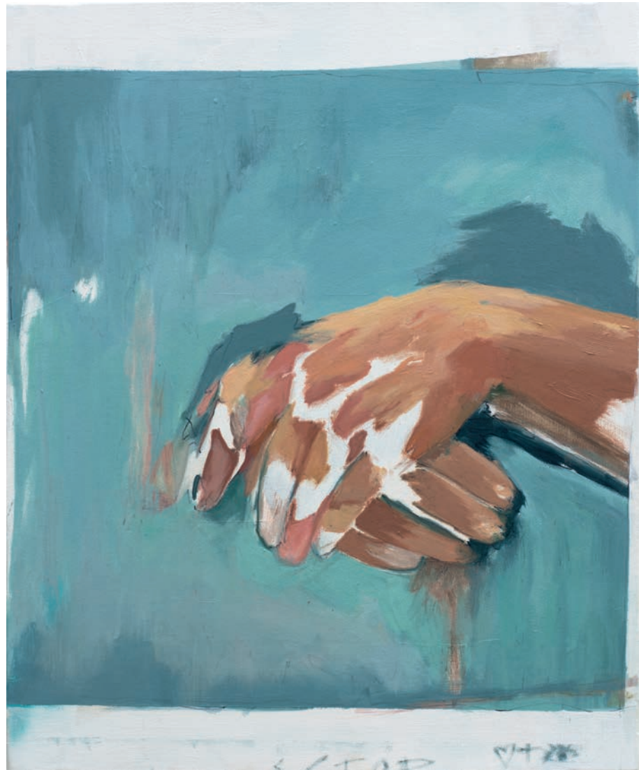
La lucidez tiene forma, color y silencio | Técnica mixta sobre lienzo | 46 x 38 cm