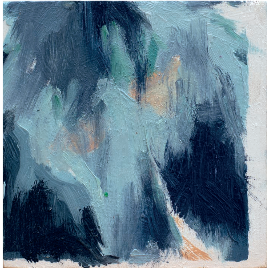
Quemando ruido 1 | Óleo sobre tabla | 10 x 10 cm