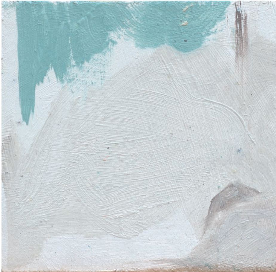
La forma imaginada | Óleo sobre tabla | 10 x 10 cm