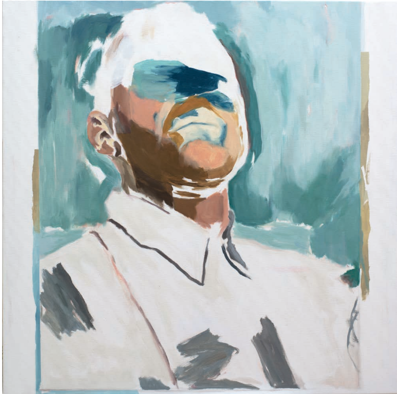
Perforando la burbuja | Técnica mixta sobre lienzo | 100 x 100 cm