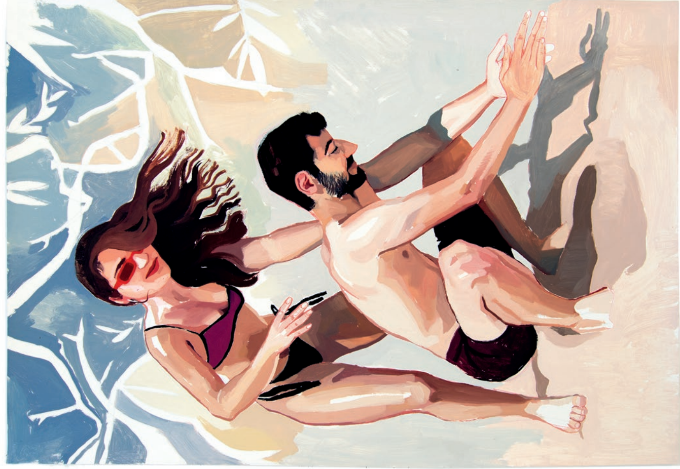
La escalera (díptico)